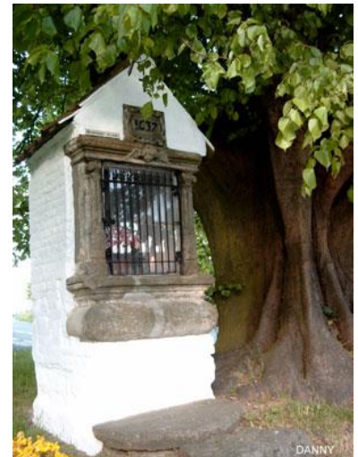
Balegem: Kapel Issegem

De eigenaars van de steengroeve gaven evenwel uitvoerig een zeer interessante uitleg over het ontginnen van de steeds zeldzamer wordende Balegemse zandsteen. In de loods stonden grote zaagmachines die deze harde steen met slechts 20 cm per uur kunnen doorklieven. Hij wordt gebruikt voor allerlei restauraties, maar is toch ook nog steeds te verkrijgen voor privédoeleinden. Uiteraard hangt er een mooi prijskaartje aan vast.