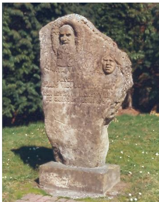
Landskouter: Gedenksteen Pater Van de Velde

Mooi op tijd vertrokken de aanwezigen met drie bussen naar de eerste locaties op het terrein. De steengroeve te Balegem werd slechts gedeeltelijk bezocht: door de overvloedige regen van de voorbije nacht en de niet aangepaste kledij was het onbegonnen werk om deze te bezoeken.