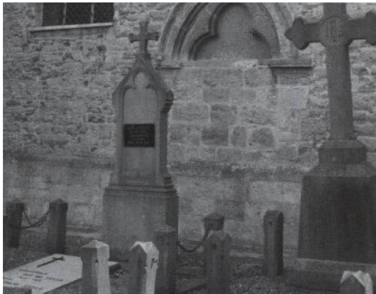
Moortsele: muur van de kerk.

In de namiddag zouden enkele van deze gebouwen bezocht worden.